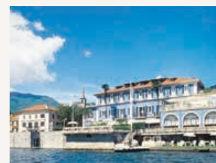
Hôtel en bordure de lac Hôtel Due Palme