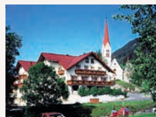
Gasthof Bären www.holzgau.net