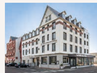
Hôtel La Villa Marine www.hotel-lavillamarine.com