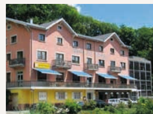
Hôtel La Perle des Vosges www.perledesvosges.net