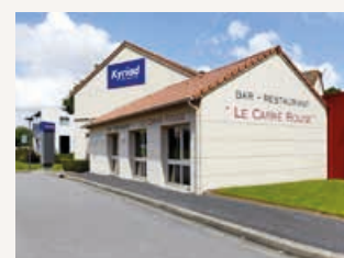
Hôtel BestWestern San Benedetto *** www.sanbenedetto-hotel.com/