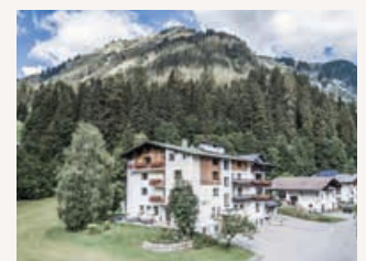
Hôtel Vera Monti www.vera-monti.at