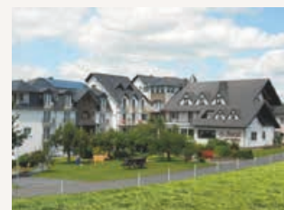
Hôtel ZUM REHBERG www.hotel-rehberg.de