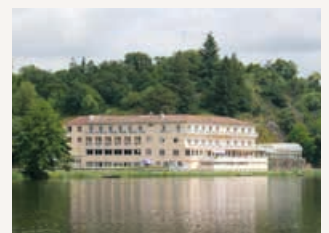
Le Moulin Neuf à Chantonay www.moulin-neuf.net