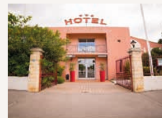
Le Clos de l'Aube Rouge www.auberouge.com